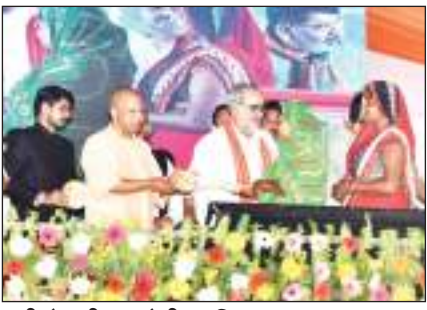
यूपी के सीएम योगी आदित्यनाथ एक कार्यक्रम में शामिल हुए।